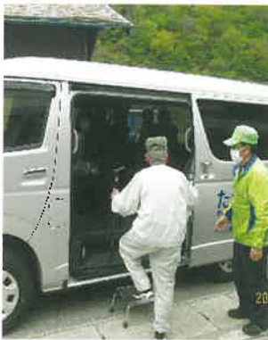
「たかね号」町内巡回

あり、多くの場面で頼りにされる存在です。委員活動の他に各々が他の役割を担い奮闘しています。