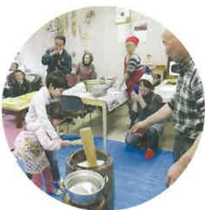
「餅つき大会」多世代交流

地域づくりの大切な担い手としてこれからも、住民が地域で心ゆたかに安心して生活ができるよう住民のみなさんに寄り添いながら活動を続けていきます。